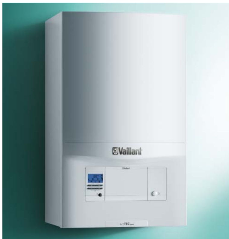
ecoTEC pro VU INT II 246/5-3 A